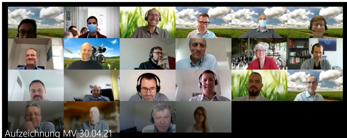
Photo : L'assemblée générale 2021 s'est déroulée en vidéoconférence

Les acteurs du secteur ont été informés de la décision de l'assemblée générale, la déclaration d'intention pour les moulins d'aliments pour animaux, les commerçants et les importateurs a été rédigée et envoyée à une centaine d'entreprises en collaboration avec ProCert. Avec la déclaration d'intention, les entreprises ont indiqué quels composants d'aliments pour animaux elles se procurent, négocient ou utilisent. En outre, elles ont donné leur accord pour le reporting des importations et pour des contrôles aléatoires. Le retour des déclarations d'intention signées a duré jusqu'à la fin de l'année. Les exploitations individuelles qui n'ont pas signé de déclaration d'intention ont été retirées de la liste des exploitations ayant le statut de réseau sur www.sojanetzwerk.ch . Les exploitations qui n'ont pas signé de déclaration d'intention ont été exclues de la liste.